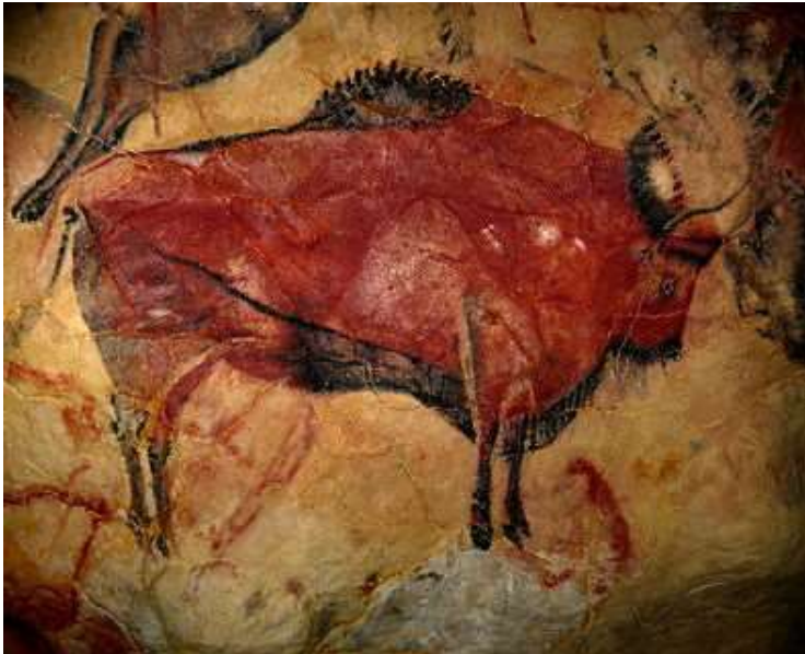
Pictura in li Cava de Altamira (Hispania).