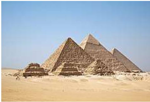
Piramides de Gizah, in Egiptia.

Li romanes ne solmen conquestat li nov territorias, ili introductet lor lingue, costumes, leges e cultura. Ti processu es nominat romanisation.