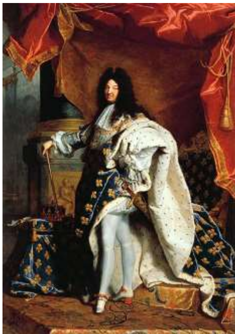
Louis 14, le "Rey Sol", exemple del absolutisme, esset rey de Francia.

Li assalta al Bastille marca li comense del Revolution Francesi.