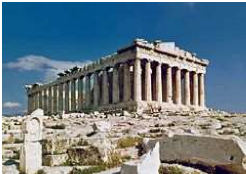
Li Partenon de Athenas, fat per li grecos.